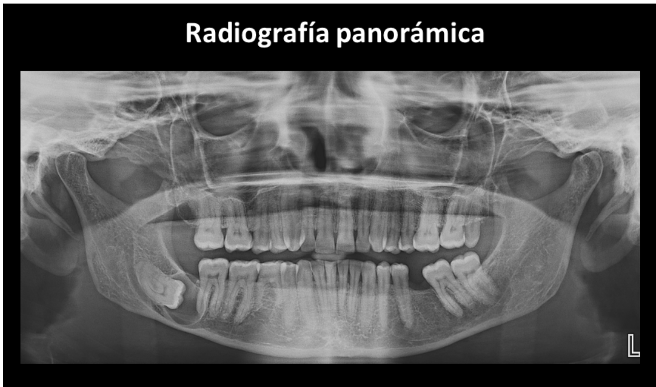
Fig. 1 Radiografía Panorámica

En la radiografía panorámica (Fig. 1), se observa la pieza 48 retenida y con una imagen radiolúcida circundante a la corona, de límites definidos y bordes corticalizados, además, de la agenesia de la pieza 45.