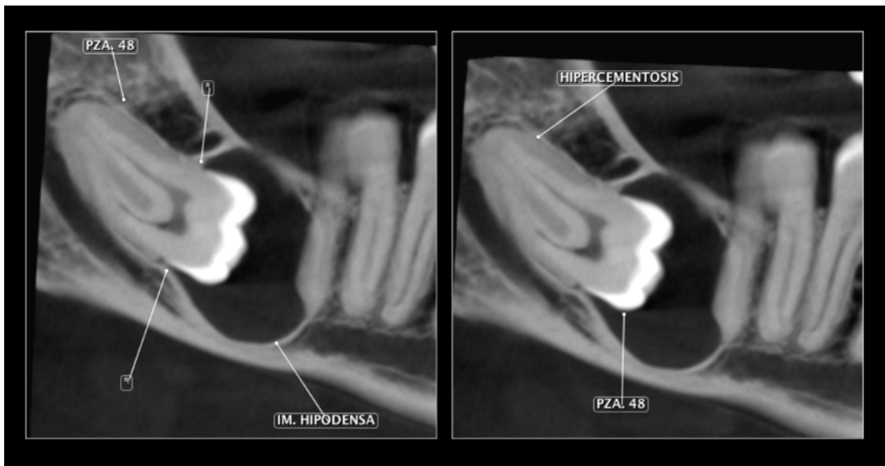
Fig. 2 Cortes Sagitales

En las reconstrucciones multiplanares, en los cortes sagitales y transaxiales (Fig. 2 y 3), se observa la pieza 48 retenida, en posición horizontal, orientada hacia ambas tablas óseas, con una imagen hipodensa pericoronaria amplio, de límites definidos, bordes corticalizados y forma redondeada, que se extiende hasta la raíz distal de la pieza 47, ocasionando un ligero adelgazamiento de la tabla ósea lingual, la pérdida parcial de la lámina dura de la raíz distal de la pieza 47 y leve desplazamiento del conducto dentario inferior adyacente en sentido caudal.